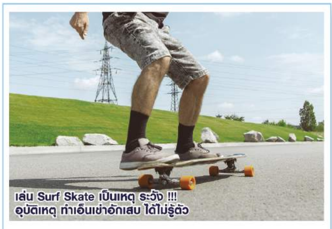
เล่น Surf Skate เป็นเหตุ ระวัง !!! อุบัติเหตุ ทำเอ็นเข่าอักเสบ ได้ไม่รู้ตัว