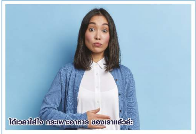
ได้เวลาใส่ใจ กระเพาะอาหาร ของเราแล้วละ