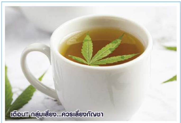
เตือน!! กลุ่มเสี่ยง...ควรเสี่ยงกัญชา