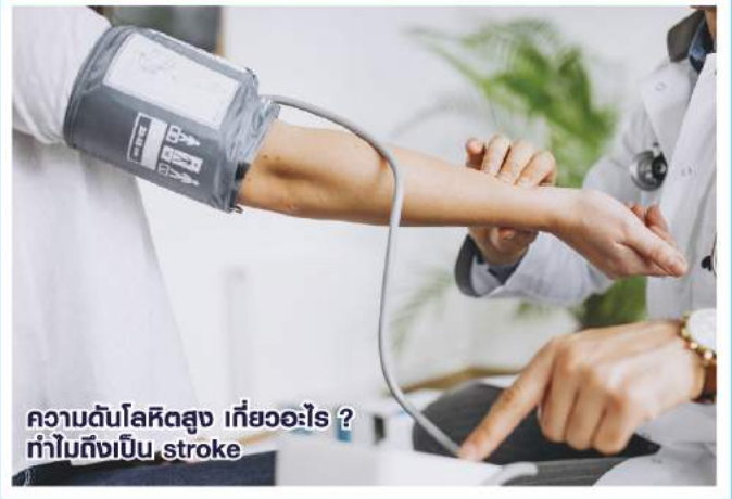
ความดันโลหิตสูง เกี่ยวอะไร ? ทำไมถึงเป็น stroke